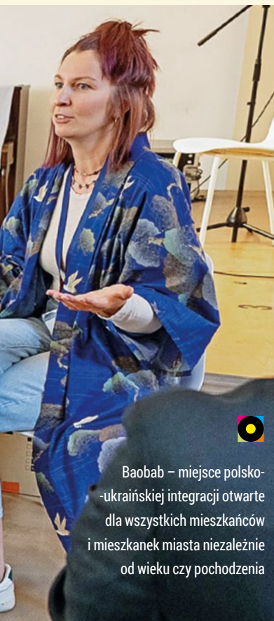
Baobab – miejsce polsko-ukraińskiej integracji otwarte dla wszystkich mieszkańców i mieszkanki miasta niezależnie od wieku czy pochodzenia

Prowadzenie sprawnej polityki młodzieżowej w wymiarze lokalnym jest kluczem do sukcesu samorządów.