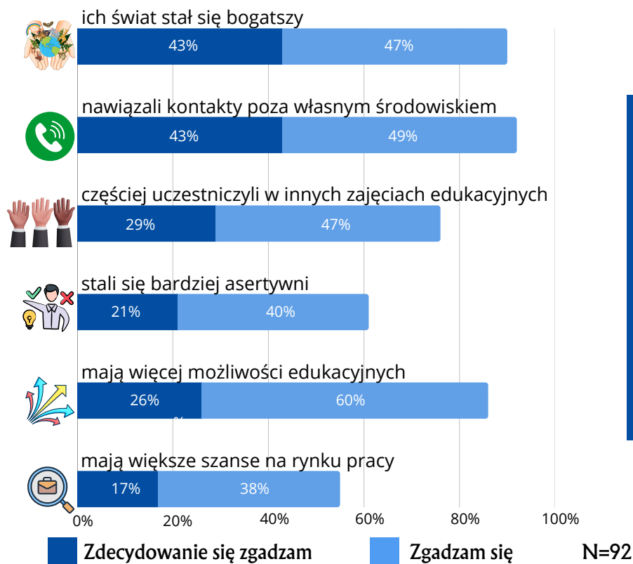
Rysunek 2. Odsetek pozytywnych odpowiedzi na pytanie „W jakim stopniu (nie)zgadza się Pan/Pani z poniższymi stwierdzeniami dotyczącymi wpływu uczestnictwa w programie Erasmus+ od 2018 r. na dorosłych słuchaczy w Pana/Pani organizacji?”

Ponad 90% przedstawicieli organizacji zgadza się, że ich podopieczni biorący udział w projektach Erasmus+ nawiązali nowe kontakty poza swoim środowiskiem oraz że ich świat został wzbogacony. Ponadto, ponad połowa badanych zauważyła, że dorośli słuchacze stali się bardziej asertywni.