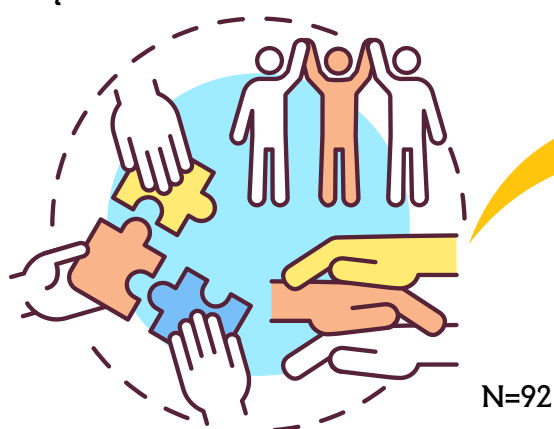
Rysunek 5. Kluczowe zmiany wskazywane przez badanych, sprzyjające zwiększeniu włączania i różnorodności