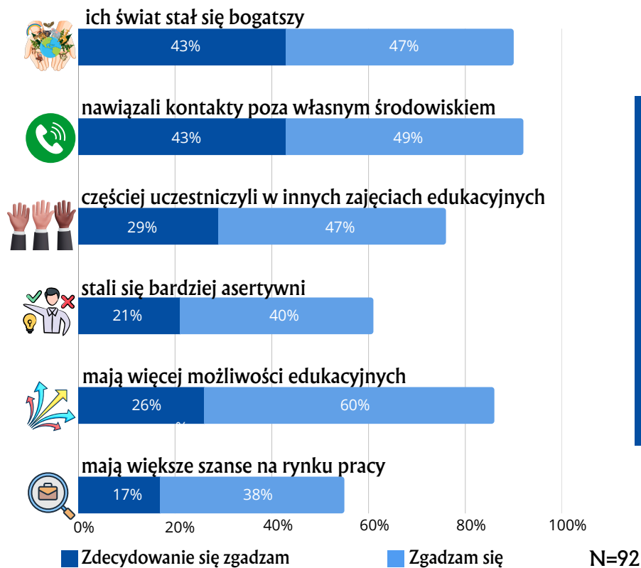
Rysunek 2. Odsetek pozytywnych odpowiedzi na pytanie „W jakim stopniu (nie)zgadza się Pan/Pani z poniższymi stwierdzeniami dotyczącymi wpływu uczestnictwa w programie Erasmus+ od 2018 r. na dorosłych słuchaczy w Pana/Pani organizacji?”

Ponad 90% przedstawicieli organizacji zgadza się, że ich podopieczni biorący udział w projektach Erasmus+ nawiązali nowe kontakty poza swoim środowiskiem oraz że ich świat został wzbogacony. Ponadto, ponad połowa badanych zauważyła, że dorośli słuchacze stali się bardziej asertywni.